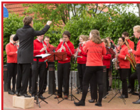
4 mei herdenking Zwanenburg