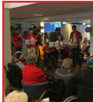
18 mei: ledenwervingsactie Leerorkest