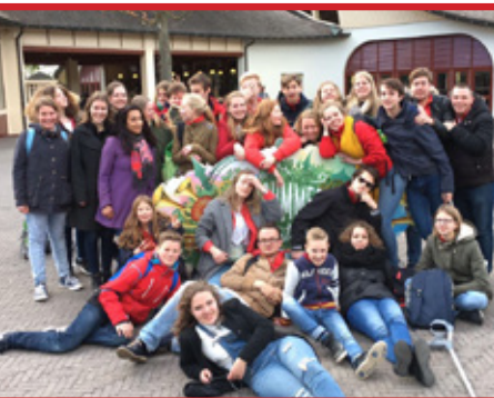
28 april: Efteling